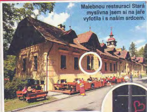
Malebnou restauraci Stará myslivna jsem si na jaře vyfotila i s naším srdcem.